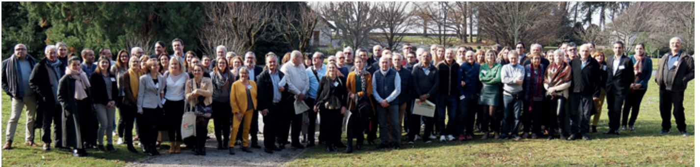
La Fondation Mérieux a cette année encore accueilli la Journée de la Prévoyance, organisée par la Mutuelle Générale de Prévoyance. Au programme de cette journée ensoleillée pour les plus de 200 participants, ateliers et assemblée plénière et déjeuner convivial.

Le 6 février dernier, la Journée de la Prévoyance a été l'occasion pour la Mutuelle Générale de Prévoyance de présenter son bilan, mais également de revenir sur le séminaire professionnel organisé à La Clusaz.